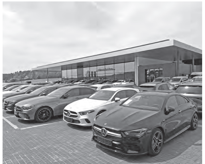
Die Ausstellung der „Jungen Sterne“ ist schon komplett in Haag.