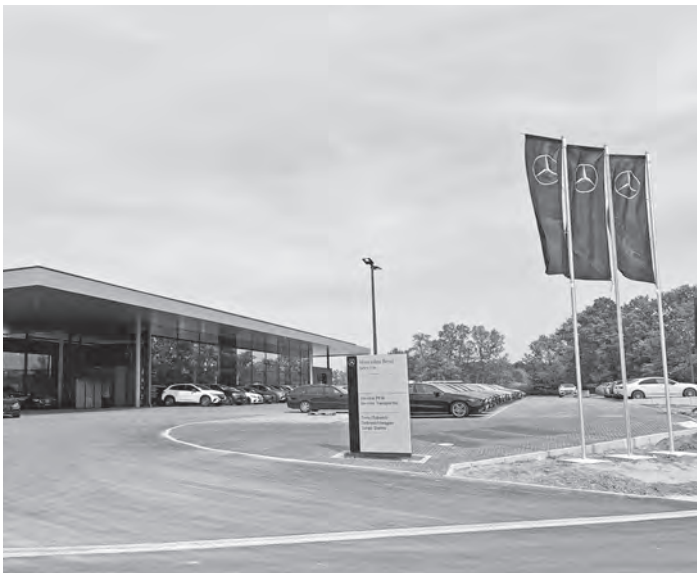
Die Zufahrt zum Autohaus ist bereits fertig.

Von der „Haager Höhe“ aus können Land- und Forstwirte ohne Einschränkungen auf den bestehenden Feld- und Waldweg in Richtung der momentan abgerissenen Autobahnbrücke zum Waldgebiet Laubenhaid fahren, die bis Ende 2024 neu errichtet werden soll. An der neu entstandenen Kreuzung zwischen B466, Haager Winkel und Haager Höhe wird demnächst eine Ampel errichtet – ebenfalls entsprechend einer Vorgabe des Staatlichen Bauamts. wog