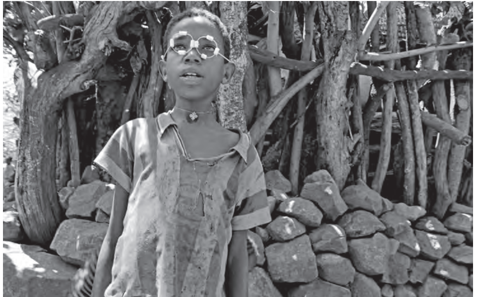
Äthiopien, ein faszinierendes, aber armes Land. Bemerkenswert: Es wurde als einziges afrikanisches Land nie von Europäern erobert.

Zuletzt sprach Dr. Schunk von den ärmlichen Gesundheitswesen des Landes, das jedoch im Prinzip bis in die entlegensten