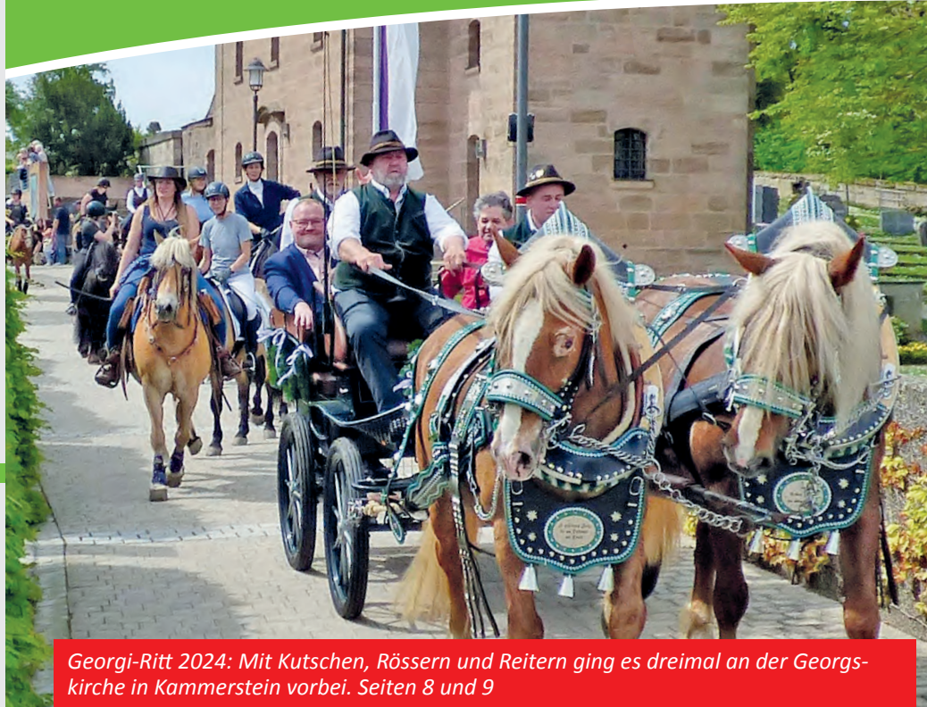
Georgi-Ritt 2024: Mit Kutschen, Rössern und Reitern ging es dreimal an der Georgs-kirche in Kammerstein vorbei. Seiten 8 und 9