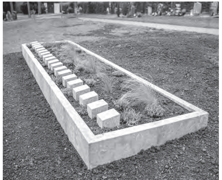
Der Erfolg: Ein pflegeleichtes Urnenfeld auf dem Friedhof Barthelmesaurach, das den Angehörigen die Grabpflege erspart.

Unabhängige EnergieBeratungsAgentur (ENA) des Landkreises Roth