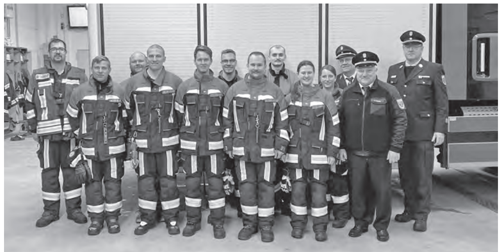
Zehn Feuerwehrleute der Feuerwehr Aurachhöhe legten ihre Leistungsprüfung Wasser ab.

Ergebnis: Alle Teilnehmer meisterten die Aufgaben mit Bravour und durften ihre Abzeichen entgegennehmen. Anschließend wurden Teilnehmer, Schiedsrichter und Zuschauer zu einer Brotzeit in den beheizten Mannschaftsraum eingeladen.