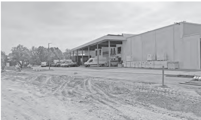
Die Außenanlagen müssen noch vollendet werden.