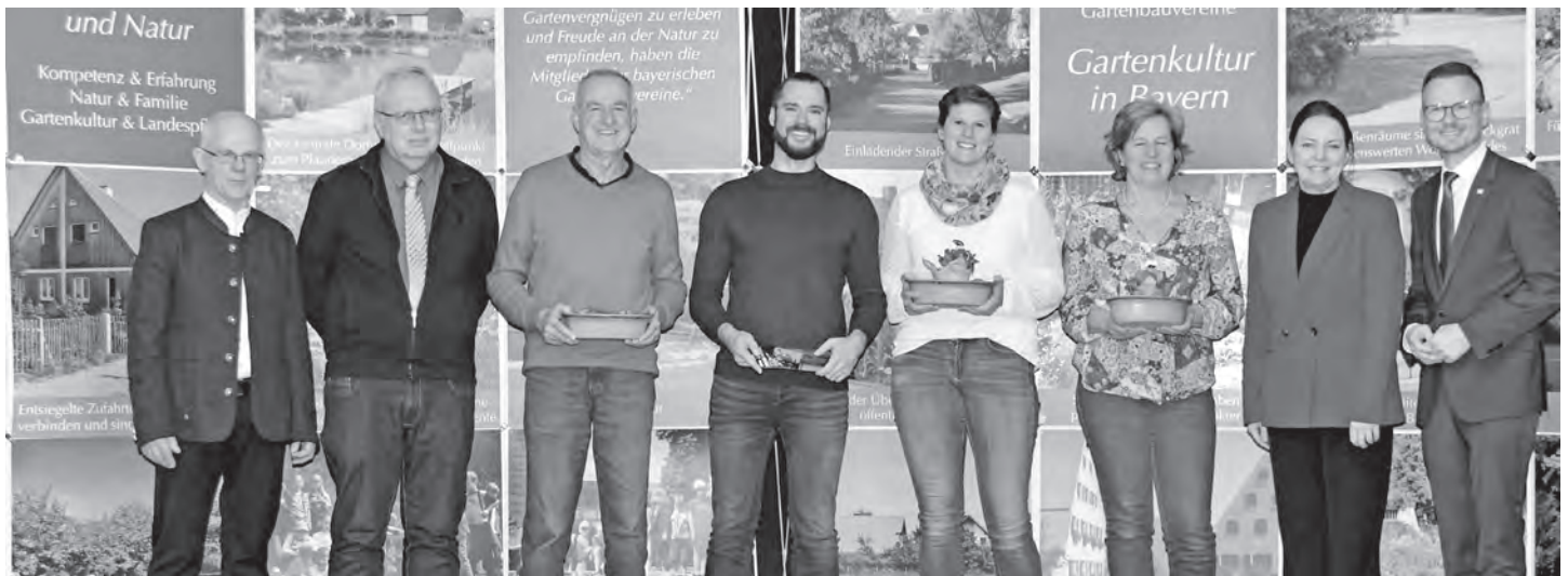
Die vorbildlichen Teilnehmer am „Tag der offenen Gartentür 2023“ aus Kammerstein erhielten vom Bezirksverband für Gartenbau je eine Keramik-Vogeltränke.