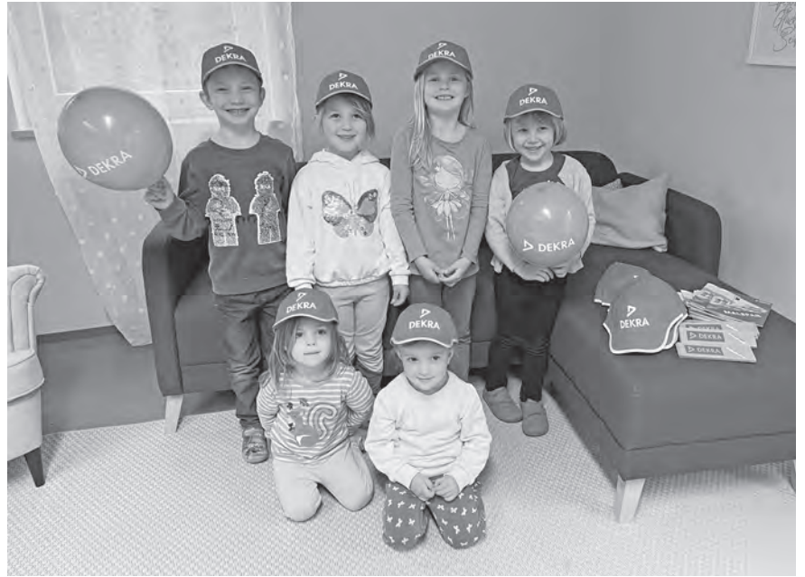
Stolz tragen die Kindergartenkinder der Kita Kammerstein ihre neuen signalroten Kappen mit Leuchtstreifen.

Zudem ist wichtig, dass Kinder wissen, wie man sich richtig im Straßenverkehr verhält. Das Thema Verkehrserziehung für Kinder ist von großer Bedeutung, auch für die Dekra. Auf der Homepage unter der Rubrik „Das kannst du sicher“, ist einiges an Informationsmaterial zusammengestellt, das Kindern vermittelt, worauf zu achten ist, wenn sie im Straßenverkehr unterwegs sind.