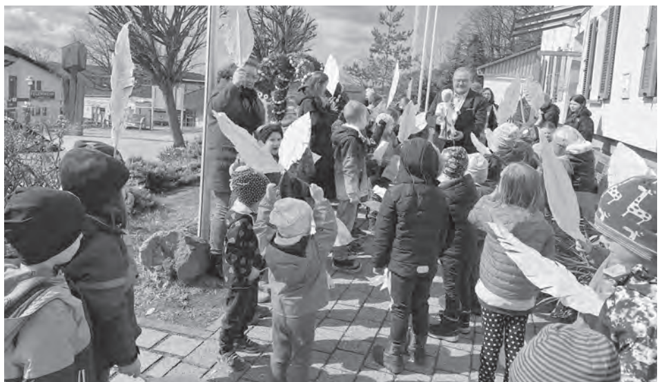
Die Ferienkinder aus dem Bauernhof-Kinderhaus Poppenreuth nahmen am Montag vor Ostern an der Osterbrunnenfeier vor dem Kammersteiner Rathaus teil.

Anmeldungen für das KiTa-Jahr 2025/26 sind jederzeit über unsere Homepage www.bauernhofkinderhaus.de möglich.