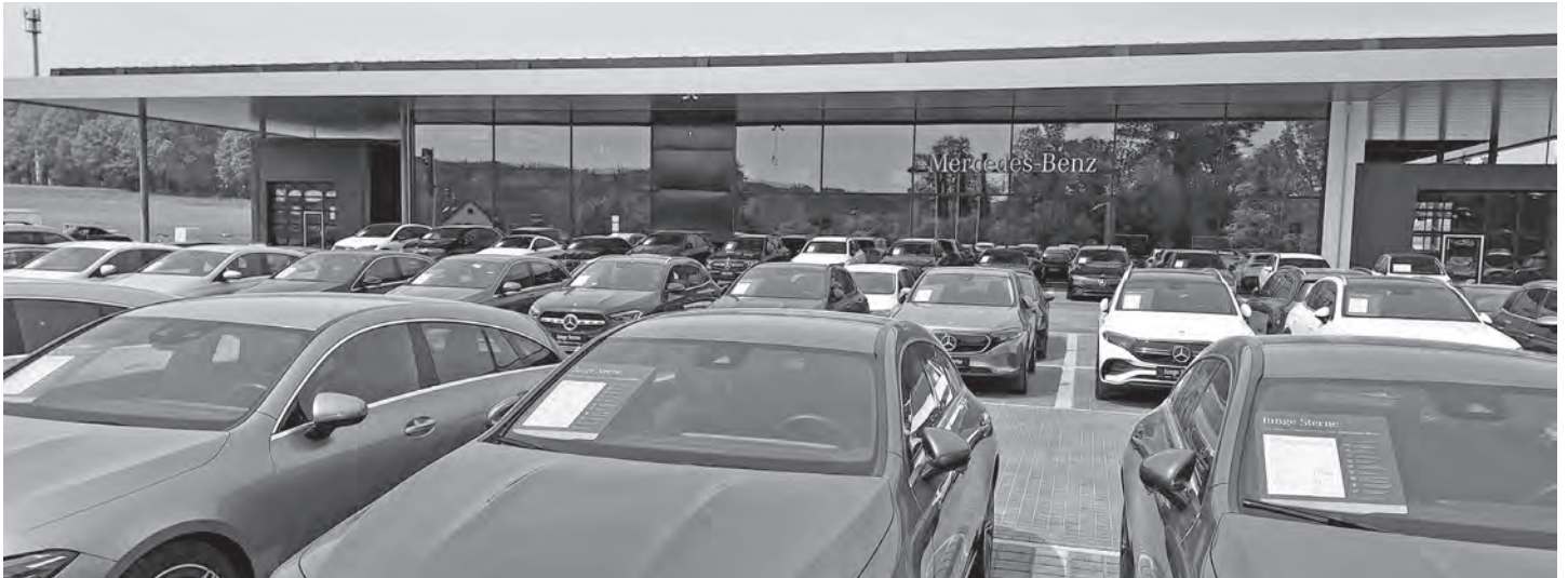
Eine riesige Auswahl von Mercedes-Pkws ist seit Anfang Mai in Haag zu bewundern.