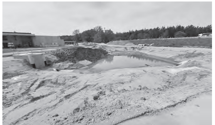
Das Regenwasser-Rückhaltebecken der Autobahn GmbH.