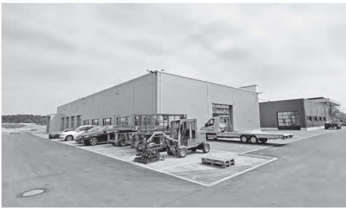
Rückgebäude: Werkstatt und Verkehrsflächen sind einsatzklar.