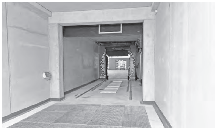
Waschanlage: Damit alle Fahrzeuge schön sauber sind.