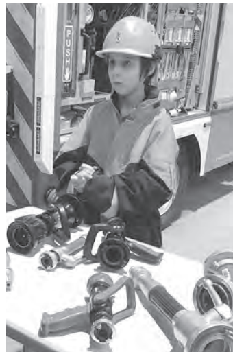
Volle Action war geboten bei der Abnahme der Jugendflamme. Die Jugendlichen mussten unter anderem Knoten kennen, Verteiler und Strahlrohre definieren und die Funktion erklären sowie Schläuche definieren und auswerfen.