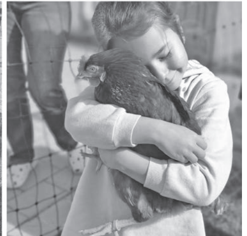
Streicheleinheiten vom Kopf bis in die Federspitzen: Vorösterliche Wellness für vier Hühner in der Kita Aurachwiese.

konnten gar nicht genug bekommen von den köstlichen Leckereien.