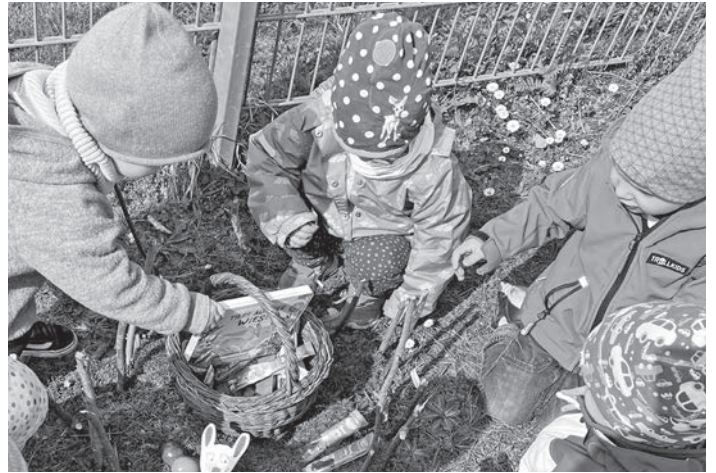
Die Knirpsenkinder entdeckten ihr befülltes Osternest.

Vielen lieben Dank an dieser Stelle! Die Kinder haben sich riesig gefreut!