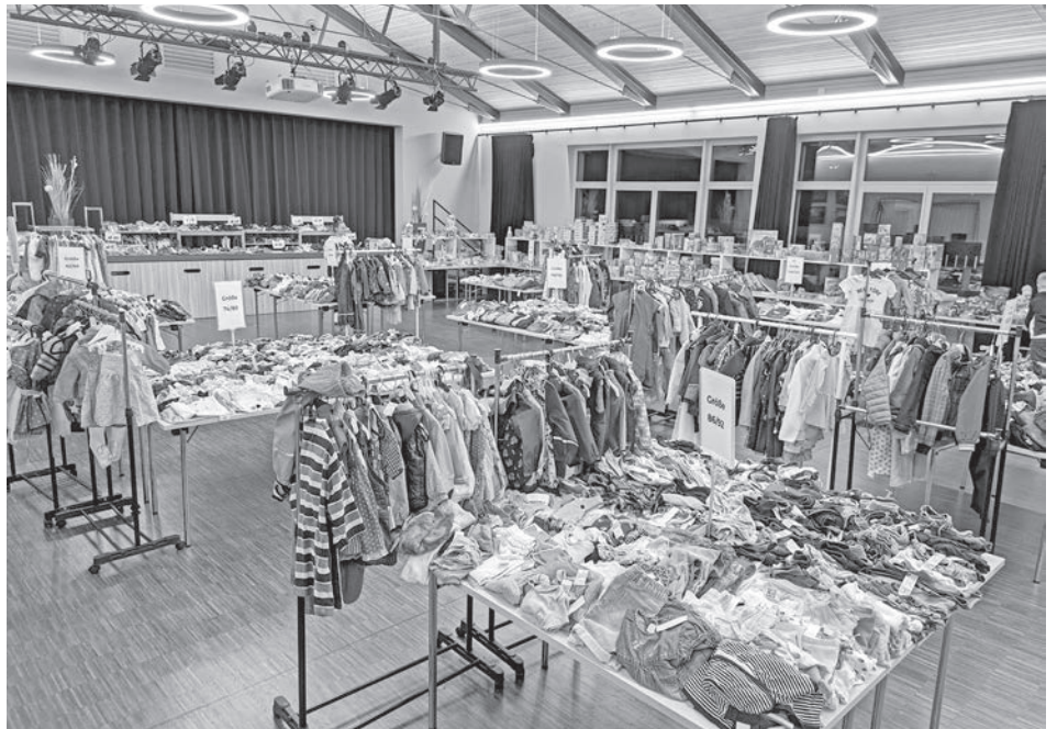
Der Verkaufsraum, der große Saal des Bürgerhauses, mit vielen tollen Artikeln.