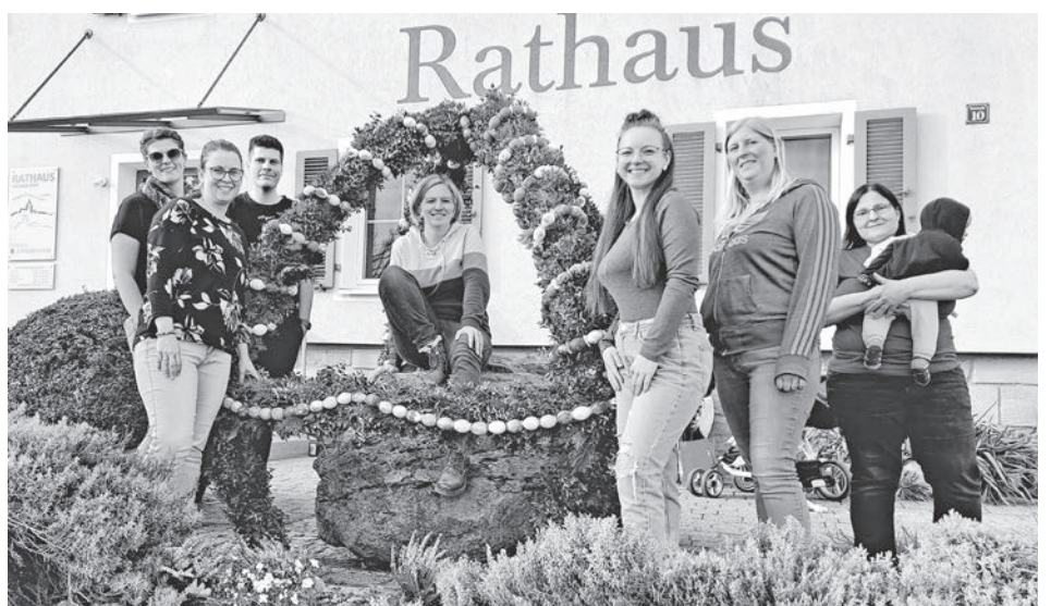
Das Team vom Elternbeirat der Kita vor dem fertig geschmückten Osterbrunnen in Kammerstein.

Bei der wirklich großen benötigten Menge an Grünmaterial wurden wir dankenswerter-