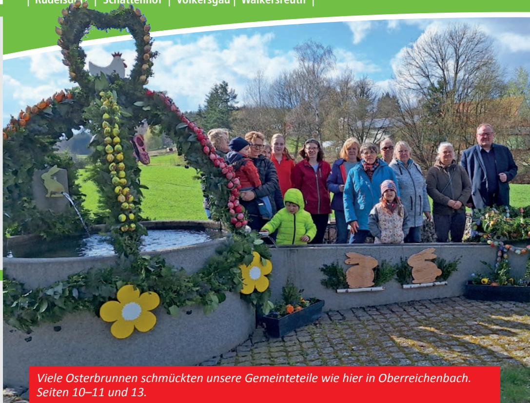
Viele Osterbrunnen schmückten unsere Gemeinteteile wie hier in Oberreichenbach. Seiten 10–11 und 13.