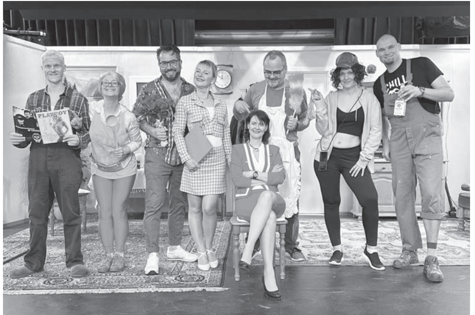
Die Kammersteiner Theatergruppe begeisterte das Kammersteiner Publikum an drei Abenden im Bürgerhaus.

Als Heinz jedoch im Streit Maria provoziert und ihr den Satz hinwirft: „Dein bisschen Haushalt, mach ich doch mit Links.....“, packt sie die Gelegenheit beim Schopf und zwingt ihn zum Rollentausch. Maria führt daraufhin für zwei Wochen die Schreinerei und Heinz den Haushalt.