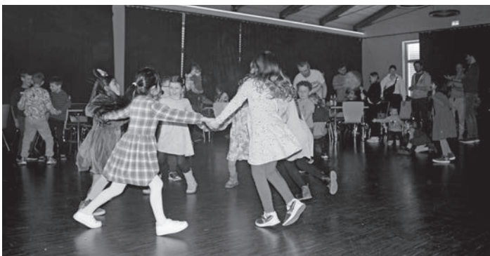
Beste Stimmung herrschte bei der ersten Kammersteiner Kinderdisco.

Zudem möchten wir uns auch herzlichst bei der Firma Kübler GmbH für die großzügige Spende, sowie bei Stefan Köhler ( www.ptl-köhler.de ) für die Musik bedanken. Außerdem gilt unser Dank allen Helfern und Mitwirkenden, der Gemeinde Kammerstein, den Mitarbeitern des Bauhofes, dem Hausmeister und natürlich den kleinen und großen Tanzmäusen, die dafür gesorgt haben, dass wir alle einen schönen Nachmittag verbringen konnten.