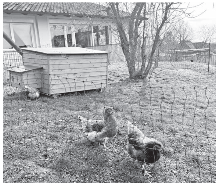
Die vier Hühner haben sich bei ihrem Oster-Besuch in der Kita Kammerstein recht wohl gefühlt.

Immer wieder ein Highlight für die Kinder! Schön, dass ihr bei uns wart, liebe Hühner!