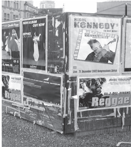
Der Gemeinderat Kammerstein hat eine Plakatierungsverordnung erlassen, die seit Anfang März gilt. Damit soll Plakat-Wildwuchs vermieden werden. (Symbolfoto)

Entscheidend darin: Öffentliche Anschläge – also Plakate, Zettel und Tafeln – dürfen nur nach vorheriger Genehmigung durch die