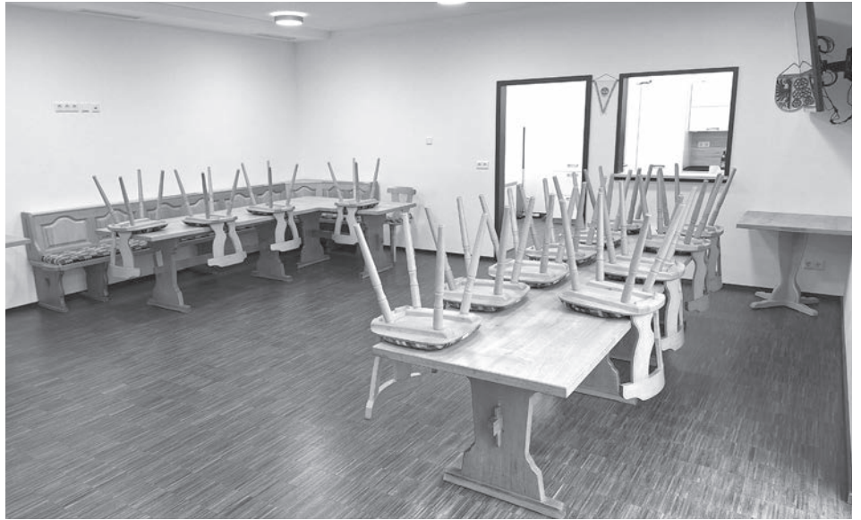
Sauber und zweckmäßig, aber recht nüchtern ist die Einrichtung der Ehrenamtskneipe im Bürgerhaus bisher. Mit 300.000 Euro vom Freistaat soll sie nun gemütlicher eingerichtet werden.

Um Förderung des Ehrenamts geht es beim weiteren gemütlichen Ausbau von Räumlichkeiten im 2019 eingeweihten Bürgerhaus Kammerstein. Im Hauptort der Gemeinde am Heidenberg fehlt seit Jahren eine Dorfwirtschaft als Ort des Austausches zwischen Vereinen und Ansichten. „Es geht darum, dass verschiedene Generationen