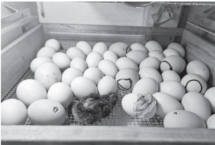
Wie aus dem Ei ein Küken wird, das erforschten die Kinder in der Regenbogen-Gruppe.

Nach einer Woche im Kindergarten durften die Kleinen zu ihren großen Artgenossen ziehen. Schön, dass ihr da wart!