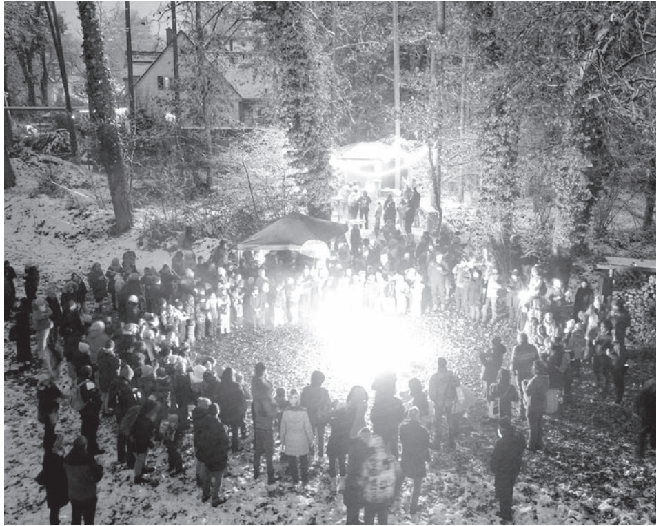
Traumhafte Weihnachtsfeier unserer Grundschule im Neuschnee.