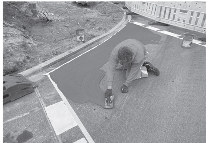
An den vier Einmündungen der B466 in der Gemeinde Kammerstein wurden die Radweg-Übergänge jetzt rot eingefärbt.