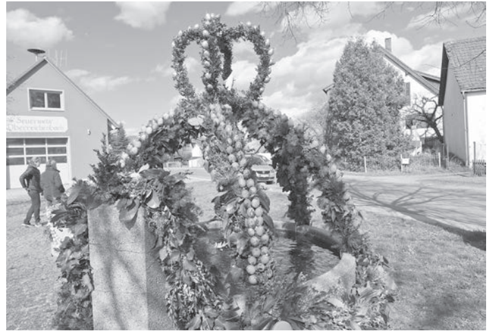
Einen wunderschönen Osterbrunnen haben die Oberreichenbacher Dorffrauen hingezaubert – zum 32. Mal hintereinander. Siehe Titelseite