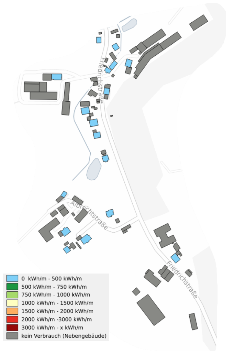
Anteile am Wärmeverbrauch- Oberreichenbach Süd