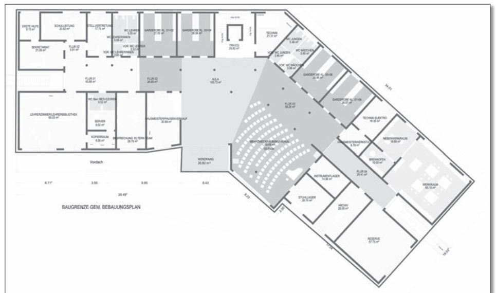
Im Erdgeschoss wird im Westteil Rektorat, Sekretariat und Lehrerzimmer untergebracht. Der Mittelteil wird Aula, Musiksaal und Hausmeisterloge beherbergen. Im Osten wird der Werkraum und ein Abstellraum vorgesehen, der auch als Ersatz-Klassenzimmer dienen kann.