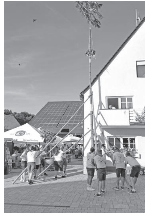
Mit großer Leidenschaft und viel Können stellten die Rudelsdorfer Kärwaboum und -madli den Kirchweihbaum beim Gasthaus Zwick auf.