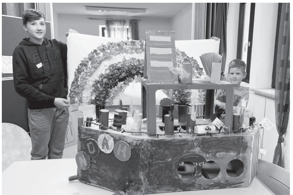
Tolles Ergebnis des Bastelspielerätsel-Tags: Die Kinder haben eine Arche Noah voller Tiere und mit Regenbogen gebastelt. Das Kunstwerk ist in der Kammersteiner Georgskirche ausgestellt.

Nach einer gemeinsamen Stärkung am Mittag ging es raus in den Pfarrgarten. Hier wurde die Geschichte mit einem Wasserspiel weiterverfolgt. Abgerundet wurde die schöne Arche Noah natürlich noch mit einem Regenbogen, der aus verschiedenen Materialien erstellt wurde. Schauen Sie doch einfach mal in der Georgskirche vorbei – da kann man das wundervolle Ergebnis bewundern.