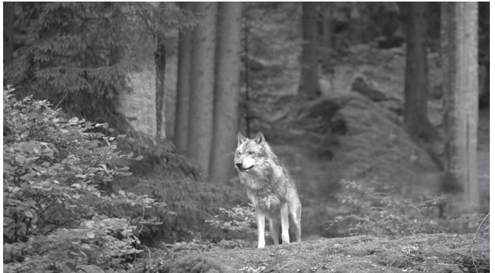
Intelligenter, aber scheuer Jäger: Einzelne Wölfe wurden schon im Landkreis Roth gesichtet. Doch sesshaft wurde der Beutegreifer bislang nicht in unserer Region. Möglicherweise ist die Gegend für ihn zu dicht besiedelt und zu laut.