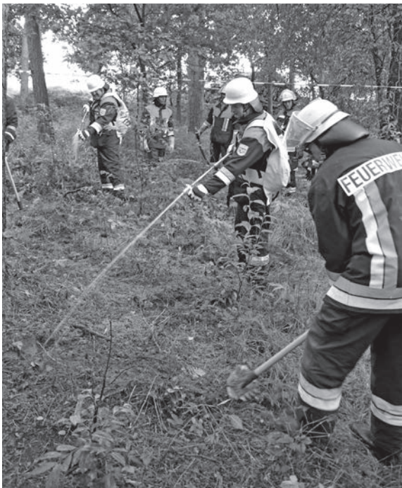
Intensive stundenlange Löscharbeiten und Umgraben des Bodens – wegen der tiefliegenden Glutnester – sind bei der Bekämpfung eines Waldbrands das A und O.