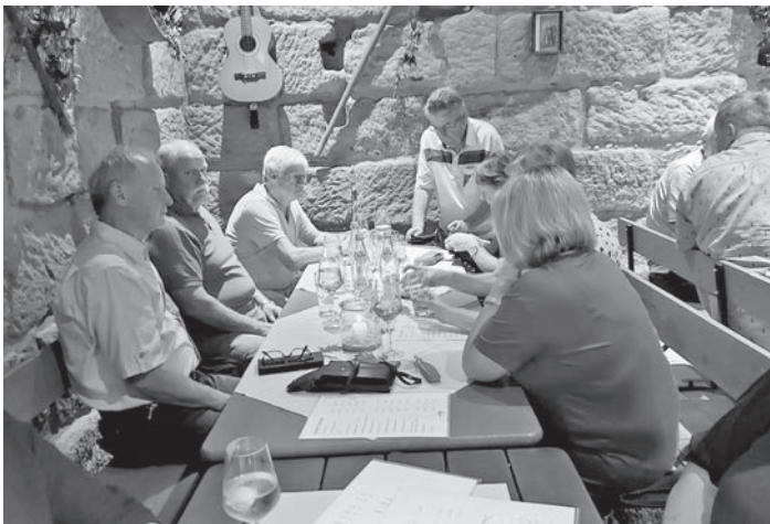
Beste Stimmung, tolle Weine – ein rundum schöner Abend war das Weinfest in Kammerstein.