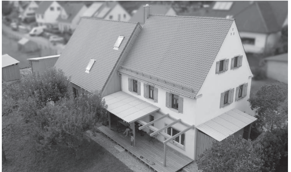
Für die zeitgemäße und nachhaltige Sanierung des Einfirsthofs in der Rudelsdorfer Straße erhält Familie Riehl den „Bayerischen Staatspreis für Erhalt der Baukultur im ländlichen Raum“.

„Es wäre billiger gewesen, wenn wir komplett abgerissen und neu gebaut hätten“, gibt Veronika Haußer-Riehl offen zu. Doch zum