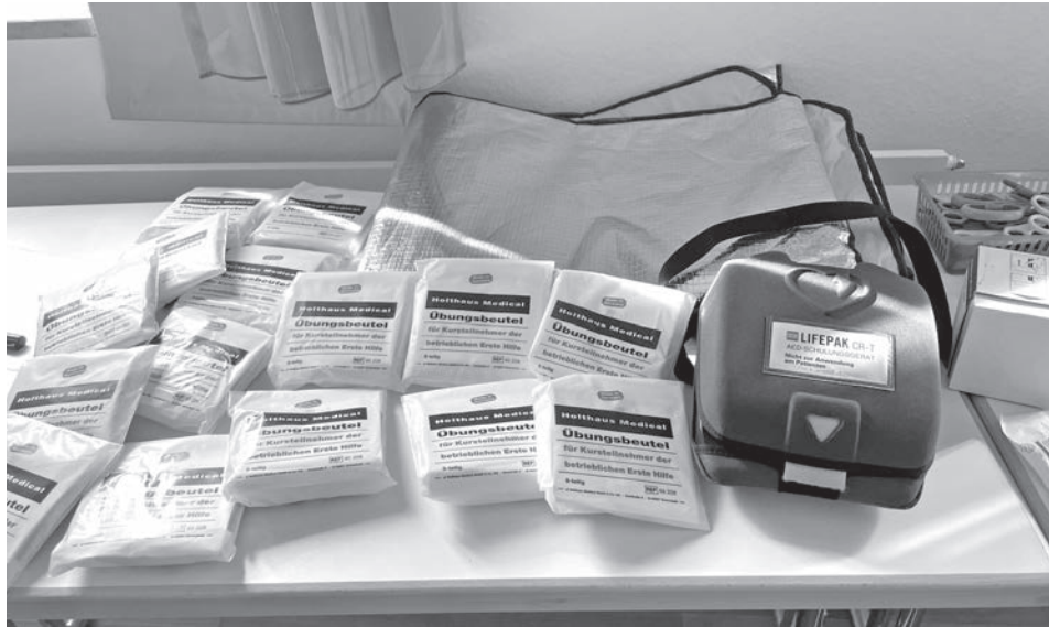
Die jungen Teilnehmer des Erste-Hilfe-Kurses lernten Vieles, wie man verletzten oder kranken Personen helfen kann.

Mit großem Respekt folgten die Kinder der kurzen Vorstellung des Defibrillators, der auch kurz AED genannt wird. Das richtige Versorgen einer Wunde durfte natürlich nicht fehlen und so wurden alle erforderlichen Maßnahmen einer gelungenen Wundversorgung besprochen.