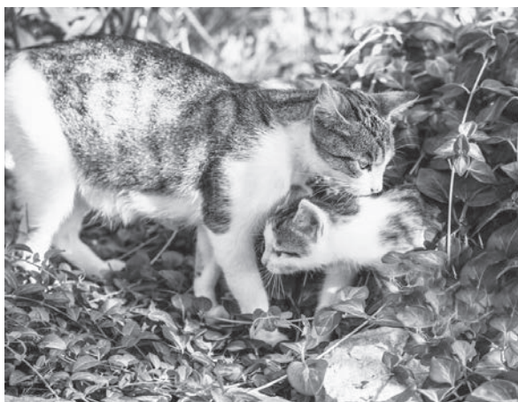
Katzenbabys sind lieb anzuschauen. Aber wenn freilaufende Katzen sich unkontrolliert vermehren, werden sie zum Problem. Daher rät die Gemeinde den Haltern dazu, freilaufende Katzen zu kastrieren.

besteht ein solches Katzenproblem, aktuell besonders in Oberreichenbach und Barthelmesaurach. Leider ist in ländlichen Gebieten in der Regel wenig Bewusstsein vorhanden,