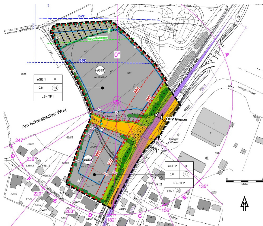
Verkleinerter Auszug aus dem Planblatt des Bebauungsplans, ohne Maßstab

Der räumliche Geltungsbereich des Bebauungsplans umfasst das Grundstück Fl.Nr. 563/7 (Teilfläche), 638/3, 641 (Teilfläche), 642 (Teilfläche) und 641/1 (Teilfläche) der Gemarkung Kammerstein, Gemeinde Kammerstein, Landkreis Roth. Die Gesamtgröße des Geltungsbereichs beträgt ca. 2,44 ha.